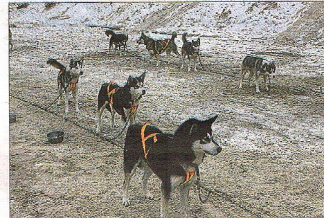
Rastløse hunde. Er vi snart klar?