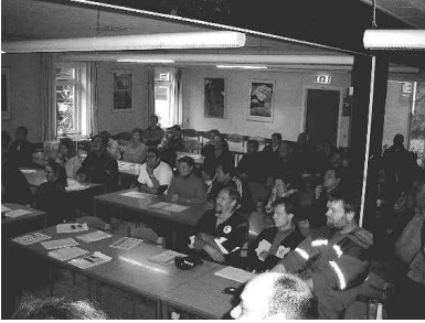
Der blev lyttet intenst under den teoretiske gennemgang.