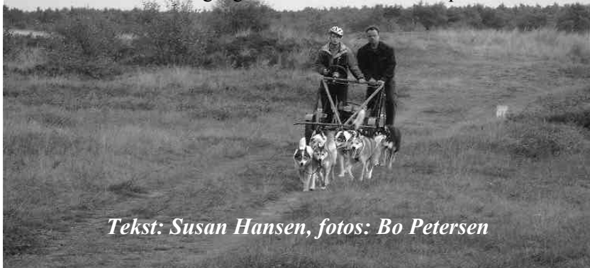
Tekst: Susan Hansen

Slædehundeseminar del II tog udgangspunkt i første del, hvor vi denne gang skulle se teorien virke i praksis.